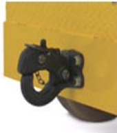
MOTOR DIESEL 22 HP 1,007cc 3-CILINDROS