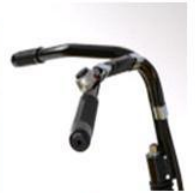
TIMON DE DIRECCION