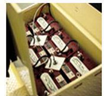
COMPARTIMIENTO PARA LA BATERIA

Si usted necesita un vehículo de remolque con capacidad excepcional , no busque más allá del Cushman el Remolcador. Está construido para Jalar cargas de hasta 5.000 libras en instalaciones interiores y exteriores. Silencio con cero emisiones de 36 voltios DC tren motriz, frenos hidráulicos de tres ruedas y controles simples y ergonómicos hacen que sea opción ideal para fábricas, centros de distribución y otras instalaciones que necesitan mover materiales de forma segura y de manera eficiente. No importa la carga, usted puede contar con el Remolcador.