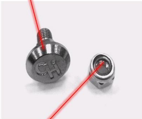
No.3 NUT PS-8PLUS-R